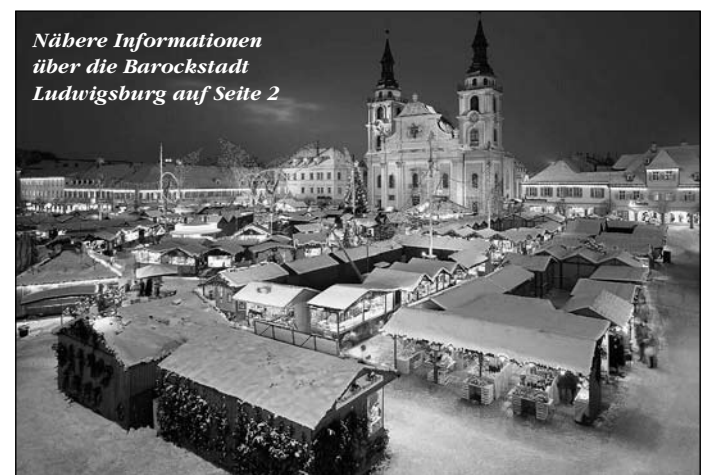
Nähere Informationen über die Barockstadt Ludwigsburg auf Seite 2