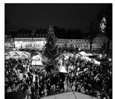
Winterzauber in Angermünde

Die Lübecker Bucht ist mit den Ostseebädern Timmendorfer Strand, Scharbeutz, Sierksdorf und Neustadt eine der bedeutendsten Tourismusregionen Deutschlands. Die vier Gemeinden streben jetzt eine intensivere Zusammenarbeit mit einer touristischen Gesamtkonzeption an. Für die Erarbeitung dieser Konzeption ist nun der Startschuss gefallen. PROJECT M wurde federführend mit der Erstellung eines Tourismuskonzeptes beauftragt. ■