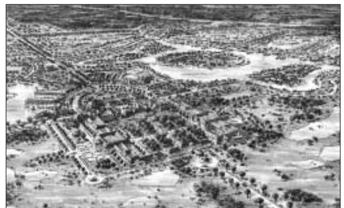
Das Schloss Beberbeck Resort aus der Vogelperspektive mit dem erweiterten historischen Schloss im Vordergrund

www.projectm.de www.krausebohne.de www.hofgeismar.de www.hessen.de